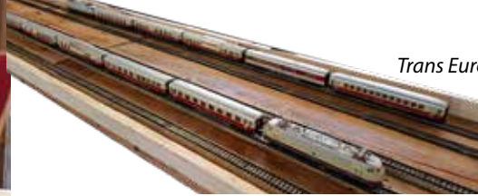
Trans Europa Express

Der Eintritt zu den Fahrtagen war frei, Kaffee und Kekse gab es auf Spendenbasis im Angebot. Die Spenden kommen dem Förderverein der Evangelischen Kirchengemeinde am Rheinbogen zugute. An den Fahrtagen waren im Schnitt jeweils 20 Interessierte gekommen, viele auch mehrfach. Von Kindern bis zu den Großeltern waren alle Altersgruppen vertreten, sogar einige Berufseisenbahner waren da.