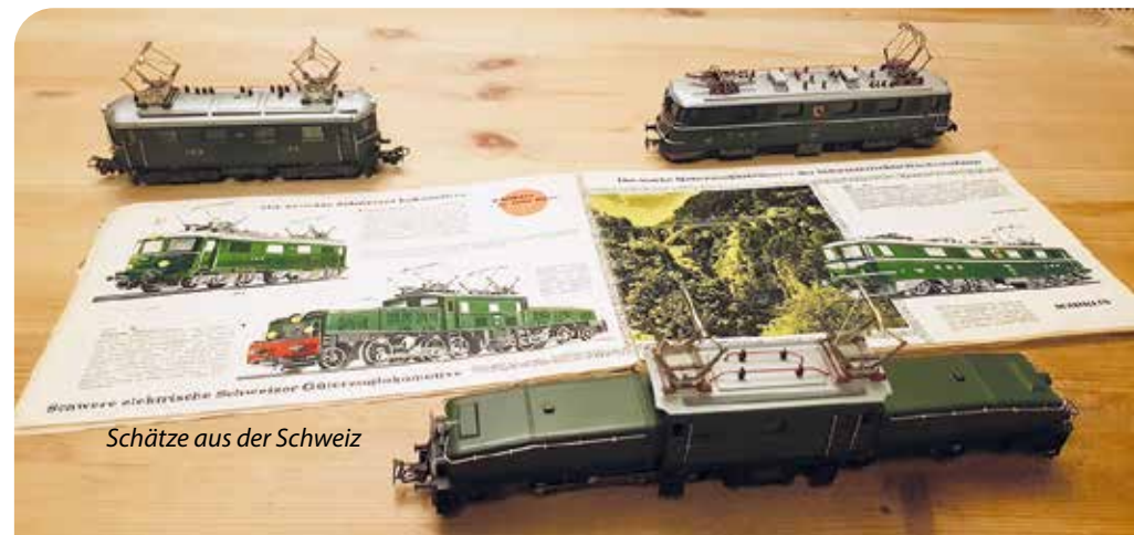
Schätze aus der Schweiz

wie zum Beispiel Züge aus Amerika, Reise- und Güterzüge aus Europa, der Trans Europa Express, oder die junge DB in der Wirtschaftswunderzeit. Landschaft gab es weniger zu bewundern, aber ein paar Gebäude haben für echte Modellbahn-Stimmung gesorgt. An allen Tagen gab es eine offene Modellbahnwerkstatt, wo interessierte Gäste ihre Lokomotiven und Waggons zu einem technischen Check mitbringen konnten. Eine Beamer-Präsentation mit Infos und Filmen von der Arbeit der Modellbahnfreunde rundete das Programm ab.